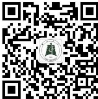
湖北大学微门户二维码

如何进行身份认证：学生用户：点击【Z.身份认证】->【身份验证】->【我是学生】进入账号绑定页面。教师用户：点击【Z.身份认证】->【身份验证】->【我是老师】进入账号绑定页面，输入统一身份认证账号和密码。验证成功后会出现个人信息界面，并提示【您已成功通过身份验证】。