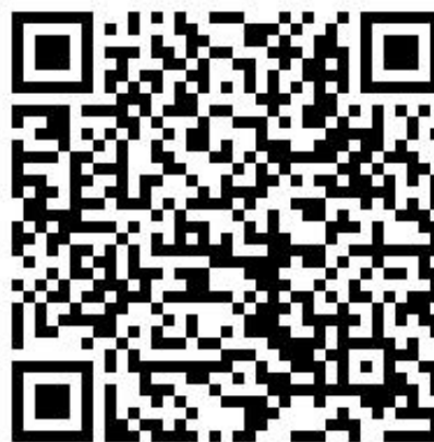
湖北大学移动校园下载二维码

安装完成后，打开“湖北大学”，输入统一身份认证账号、密码（与智慧服务中心登录账户密码一致），点击登录进入移动校园。